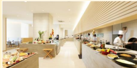
「by the ocean」イメージ

「by the ocean」レストランにて、焼きたてピザなどのライブコーナーも備えた、和洋多彩な料理が並ぶ、人気の「シラハマビュッフェ」をどうぞ。