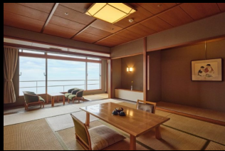
(客室一例) 日昇館 客室

宿泊先URL : https://urashimaresortsandspa.jp/wakayama-hotelurashima/