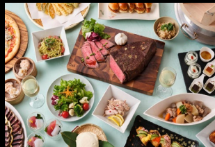
夕食バイキング イメージ