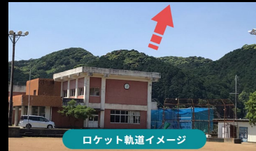
ロケット軌道イメージ