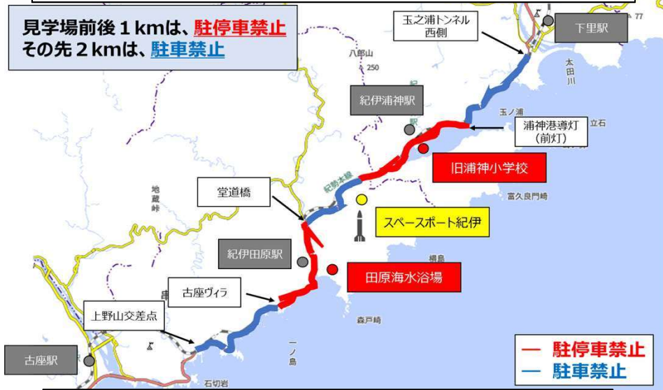
駐停車禁止区間、駐車禁止区間の設置